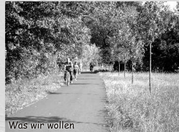
Was wir wollen