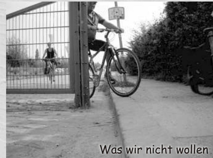
Was wir nicht wollen